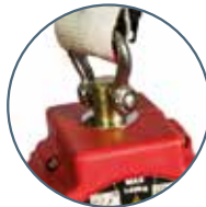
Drehwirbel am Gehäuse

Zertifiziert gemäß den Anforderungen der EN 360: 2002 VG11.085 (Fallfaktor 2) + VG11.060 (kantengeprüft) zugelassen für 140 kg (VG11.062)