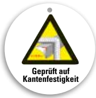
Geprüft auf Kantefestigkeit